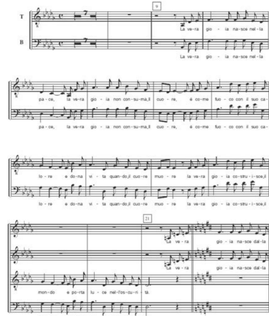
La vera gioia